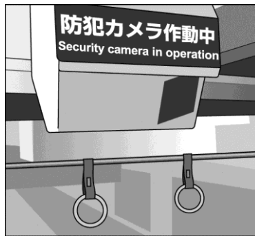
写真 電車内の防犯カメラ

生徒A：防犯カメラで撮影することは、わたしたちの X の侵害になるのかな。 生徒B：防犯カメラの目的は、より多くの人々に安心して電車を利用してもらうことかしら。 生徒A：それは Y の考え方だと思うよ。でも、人権が制限されることはないのかな。 生徒B：「国民の権利については、 Y に反しない限り、最大の尊重を必要とする」と憲法にあることを、授業で学んだわ。 生徒A： 戦前には法律で人権を制限した例もあった と思うよ。